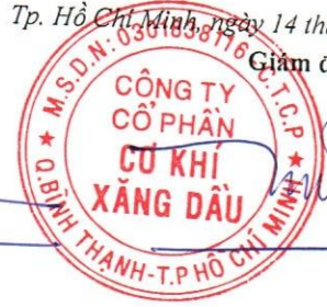
Đoàn Đắc Học